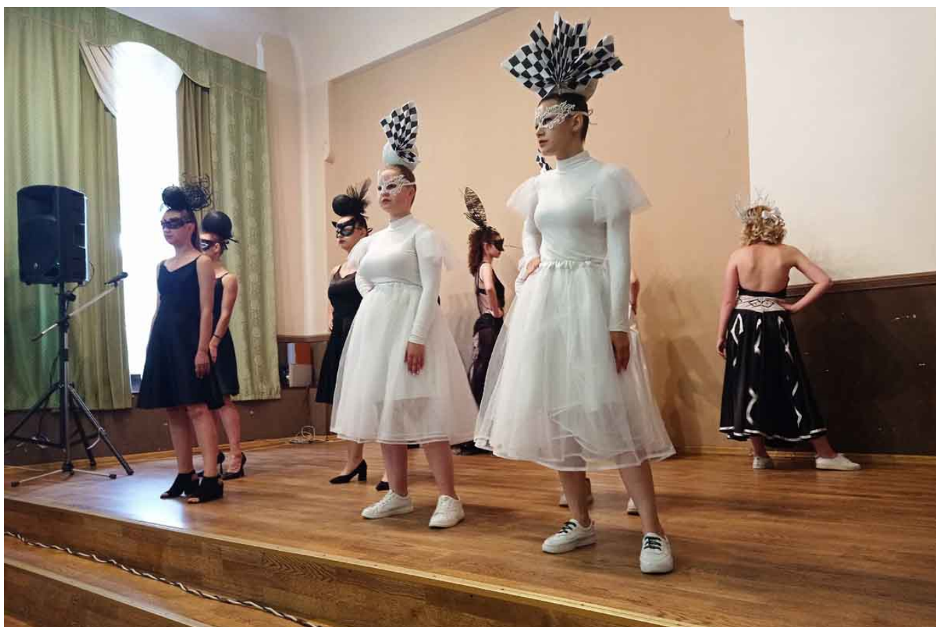
Присутствующие увидели костюмированное дефиле студентов технологического колледжа, одетых в