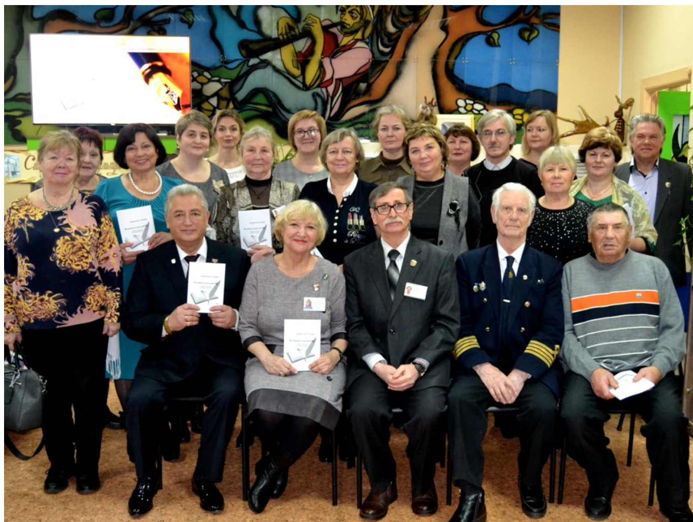
Было сделано общее фото на память.