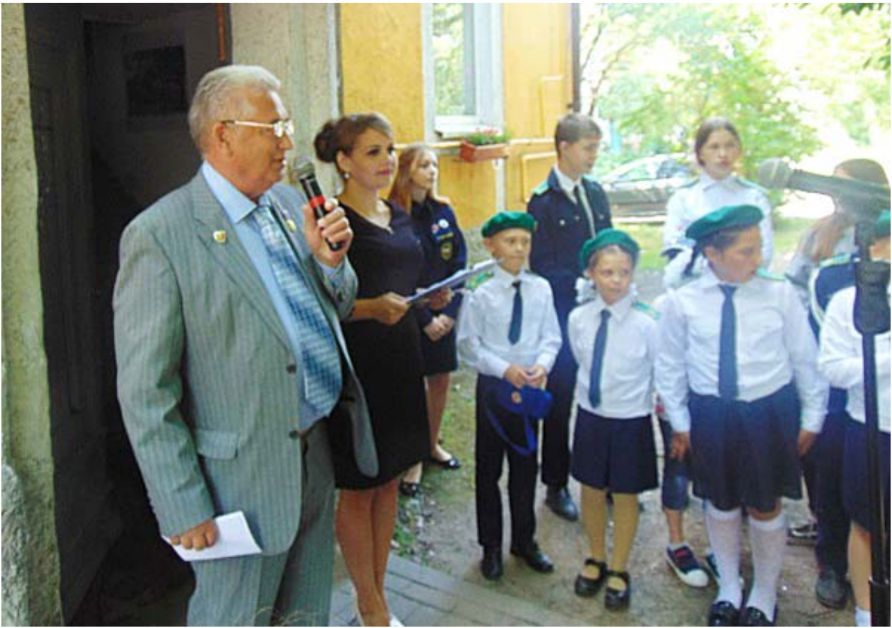
Затем было возложение цветов.