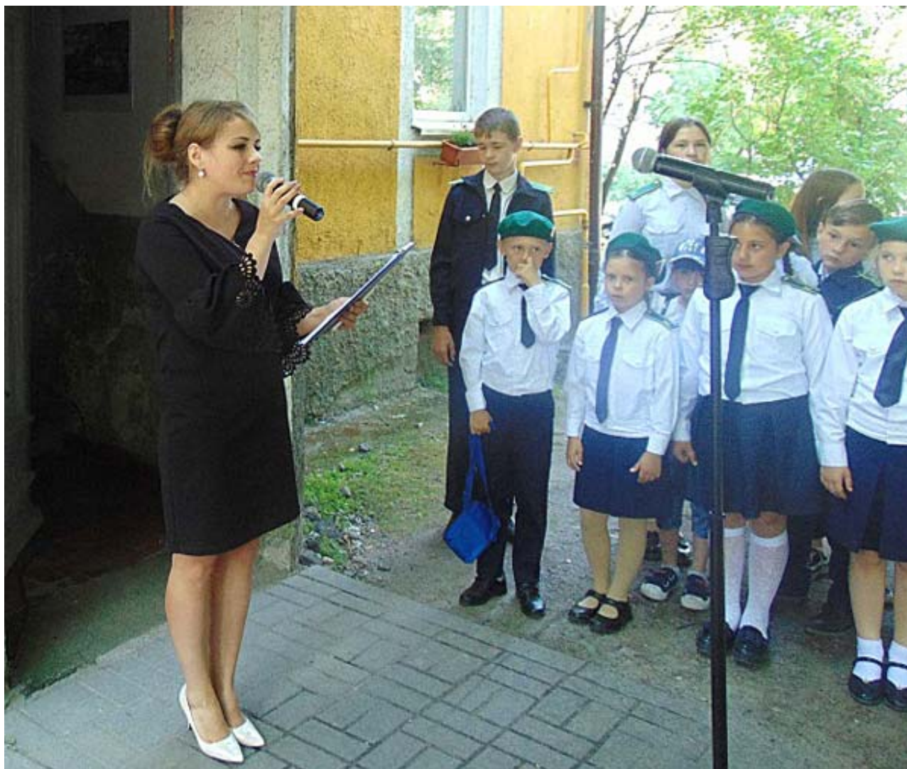
Ведущая, открывая небольшой митинг у дома Александра Твардовского, кратко рассказала историю написания поэмы «Василий Тёркин».