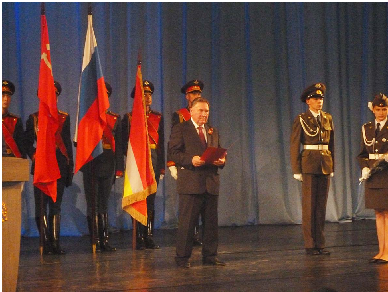
Выступление с поздравлением собравшихся Губернатора Курской области (18 лет) Александра Николаевича Михайлова.